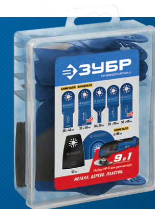
Упаковка: пластиковый кейс