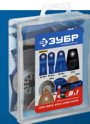
Упаковка: пластиковый кейс