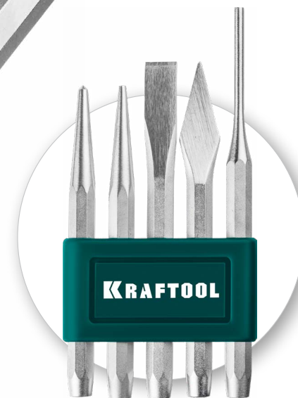
Пластиковый держатель для удобного хранения инструментов