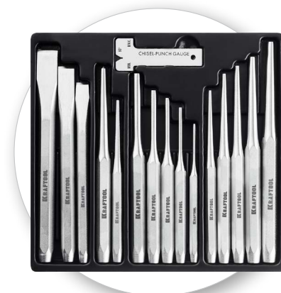
Пластиковый поддон для удобного хранения инструментов