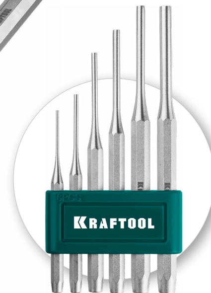
Пластиковый держатель для удобного хранения инструментов