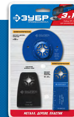
Упаковка: блистер ПВХ