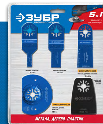
Упаковка: блистер ПВХ