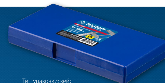
Тип упаковки: кейс