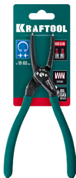
Упаковка 22812-xx: карточка ПВХ