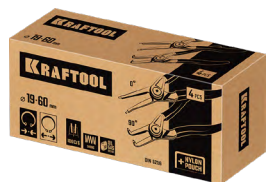
Упаковка 22812-H4: коробка картонная