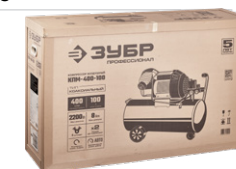
Упаковка: картонная коробка