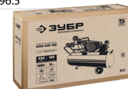
Упаковка: картонная коробка