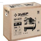
Упаковка: картонная коробка