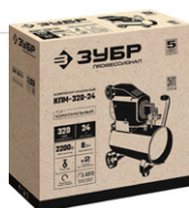
Упаковка: картонная коробка