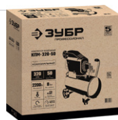
Упаковка: картонная коробка