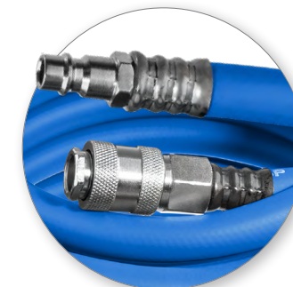
Быстросъемные рапид фитинги

Применяются для подключения инструмента к пневмосистеме