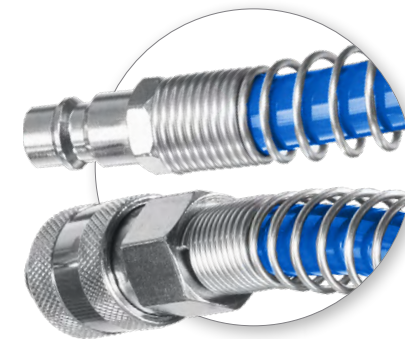
Быстросъемные рапид фитинги

Применяются для подключения инструмента к пневмосистеме