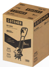
Упаковка: картонная коробка