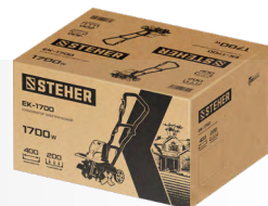
Упаковка: картонная коробка