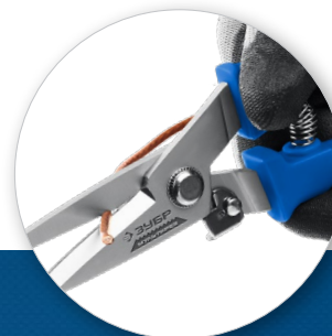
Провода, электрические кабели