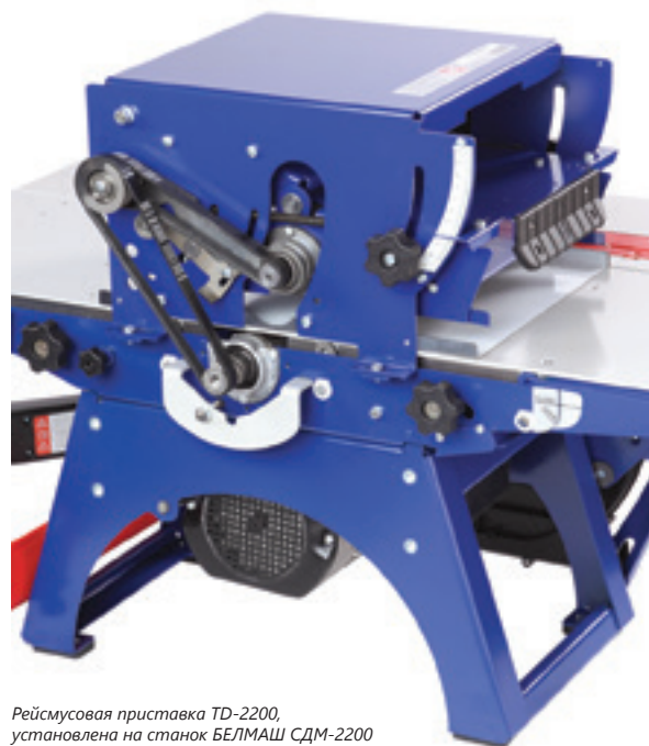
Рейсмусовая приставка TD-2200, установлена на станок БЕЛМАШ СДМ-2200

Приставка рейсмусовая, ограждение ремня, ремень, шаблон, ключ, кожух для удаления стружки, крепёж, руководство по эксплуатации, упаковка.