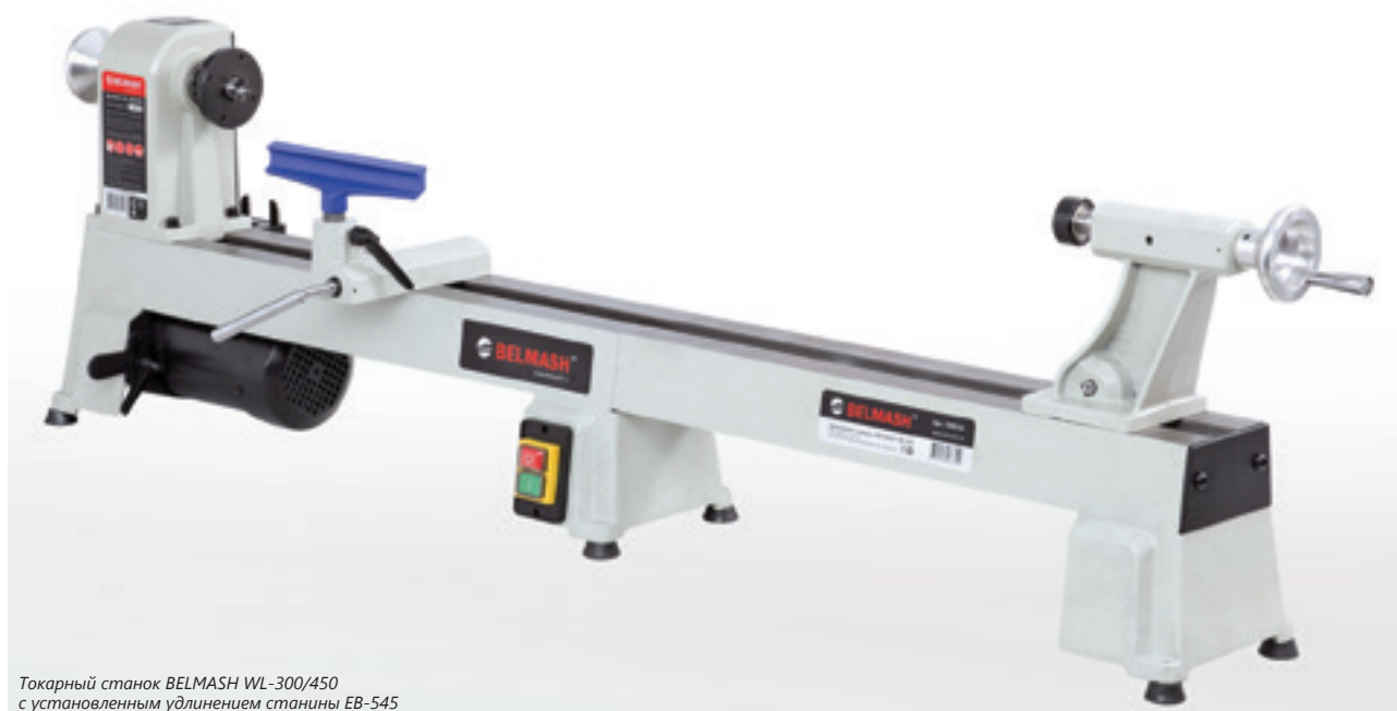
Токарный станок BELMASH WL-300/450 с установленным удлинением станины EB-545