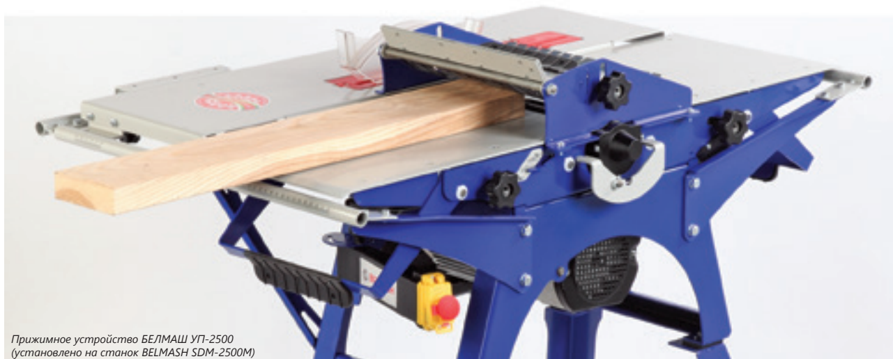
Прижимное устройство БЕЛМАШ УП-2500 (установлено на станок BELMASH SDM-2500M)