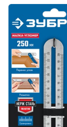
Упаковка: карточка картонная