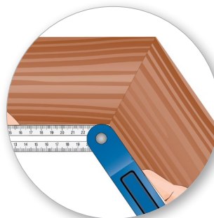
Закругленная форма полотна для удобного измерения внутренних углов