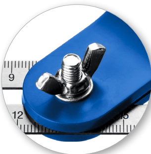
Прочный винт для надежной фиксации