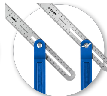
Двухсторонняя шкала для измерений как внутреннего, так и наружного угла