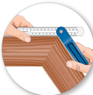
Удобное измерение внешних углов