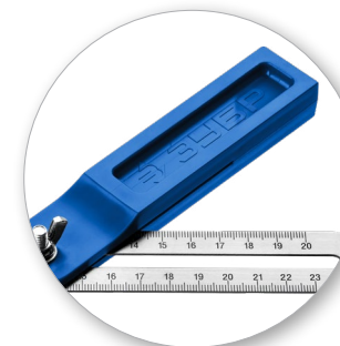
Ударопрочный корпус из АБС-пластика