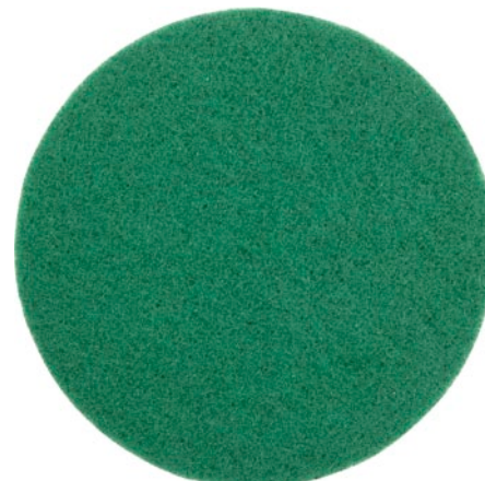
Насадка шлифовальная из нетканого волокна

Шлифовка и зачистка оштукатуренных поверхностей и стыковых швов гипсокартонных плит