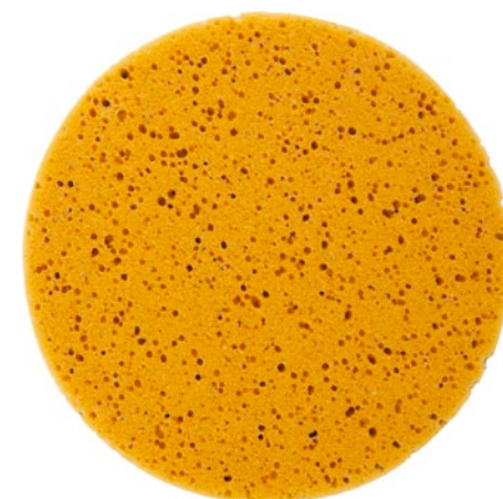
Насадка полировальная полиуретановая

Полировка лакокрасочных покрытий кузова автомобиля, а также изделий с хромированным и никелированным покрытием