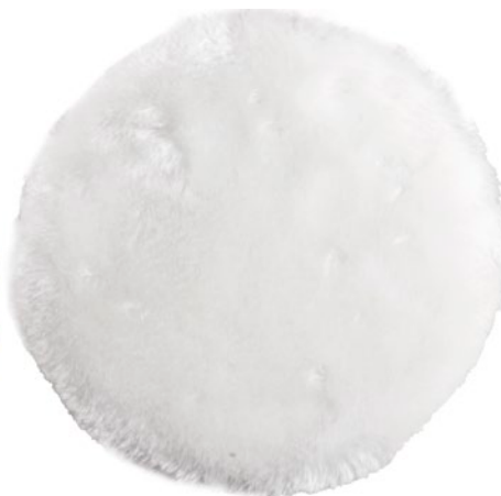
Насадка полировальная из искусственной шерсти

Крепление всех сменных насадок «на липучку» и осуществление полировально-шлифовальных работ