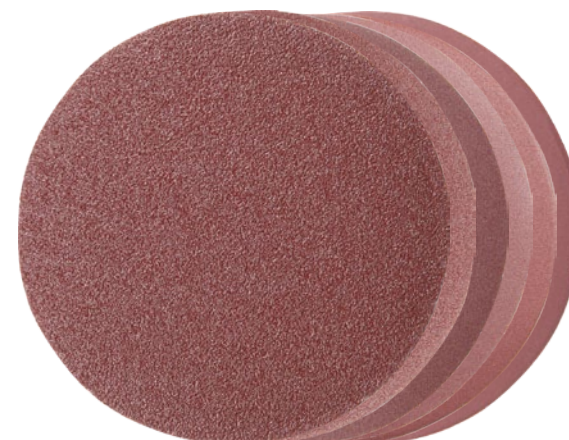
Круги шлифовальные из абразивной бумаги 6 шт.

Бережная шлифовка металла, восстановление блеска и снятие окалины