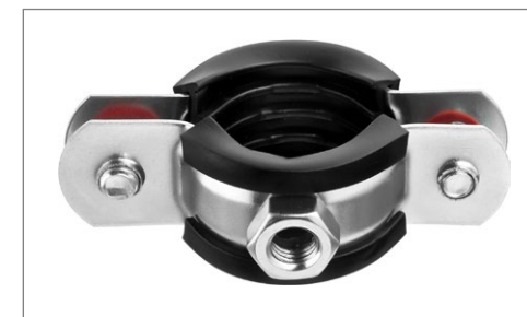
Крепление с помощью гайки

Применяется для крепления труб различного назначения при помощи шпильки с резьбой M8 и дюбеля диаметром 10 мм (не входит в комплект поставки).