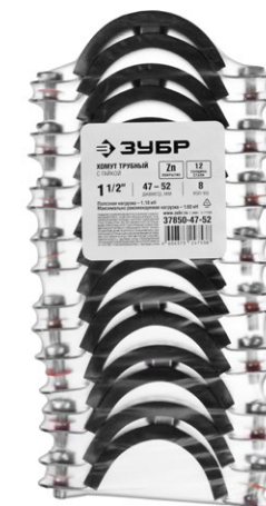
Упаковка: термоусадочная пленка