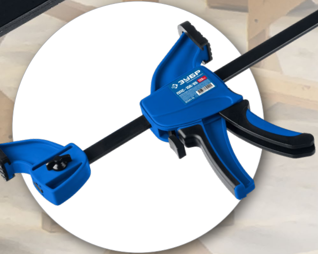
Переставная конструкция: зажим и распор