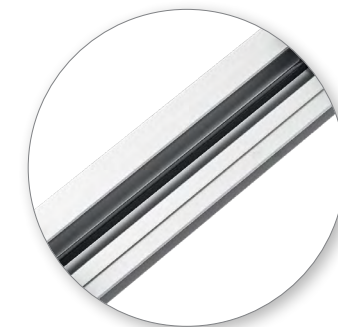
Стальная рейка с индукционной закалкой в основании шины