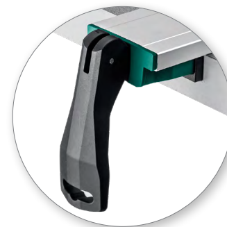
Отверстие на рукоятке для подвеса и хранения инструмента