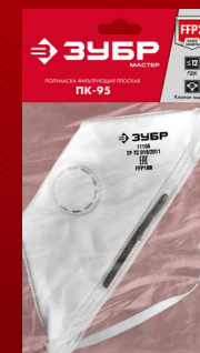
Упаковка: пакет с хедером

обеспечивают комфорт и надежную фиксацию полумаски