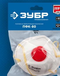
Упаковка: пакет с хедером

• Головные ремешки обеспечивают комфорт и надежную фиксацию полумаски