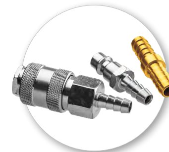
Возможность установки пневматических фитингов