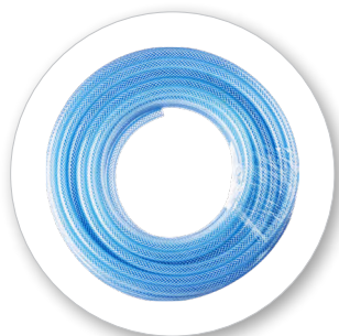
Максимальное давление 15 бар